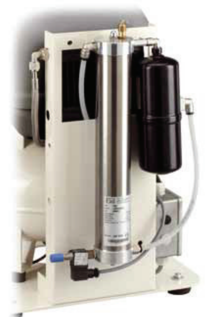
Single-column drying system