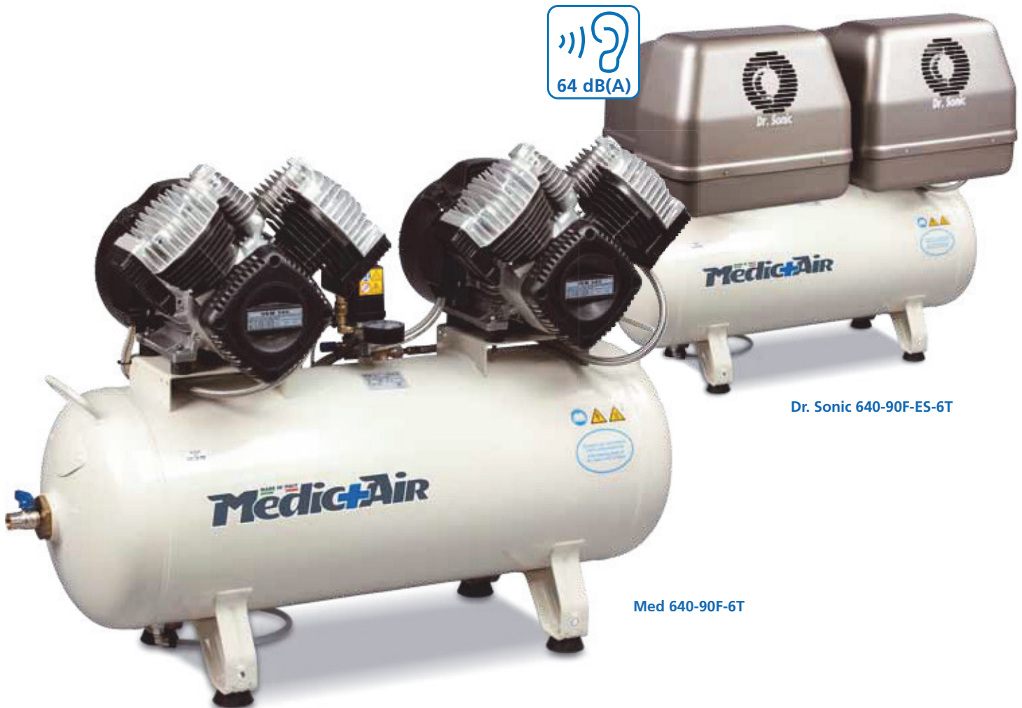
Dr. Sonic 640-90F-ES-6T