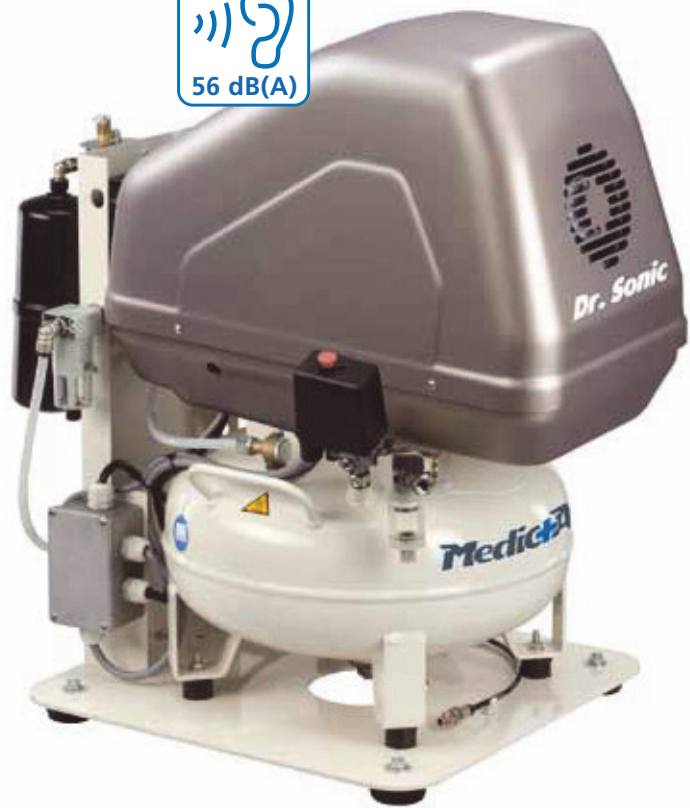
Dr. Sonic 160-24F-FM-1,5M