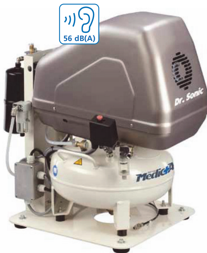
Dr. Sonic 102-24F-FM-0,75M