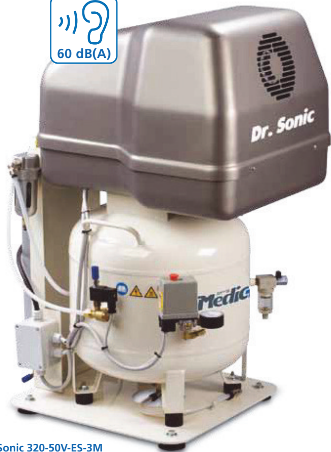
Dr. Sonic 320-50V-ES-3M